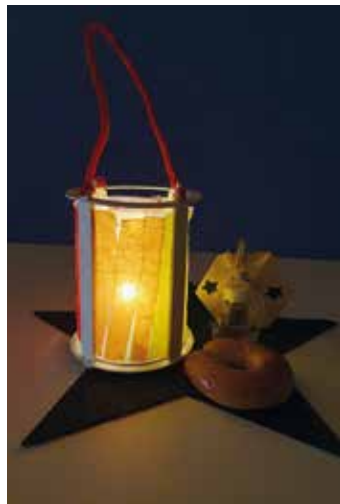
Fest des hl. Martin

Alle Kinder, die in Hadersdorf gemeldet sind, bekommen diesbezüglich eine schriftliche Verständigung seitens der Gemeinde.