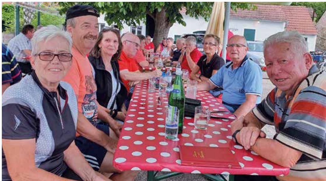
Die Radlergruppe beim Heurigen