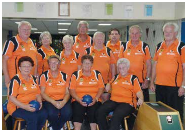
Kegelsportgruppe der OG Hadersdorf