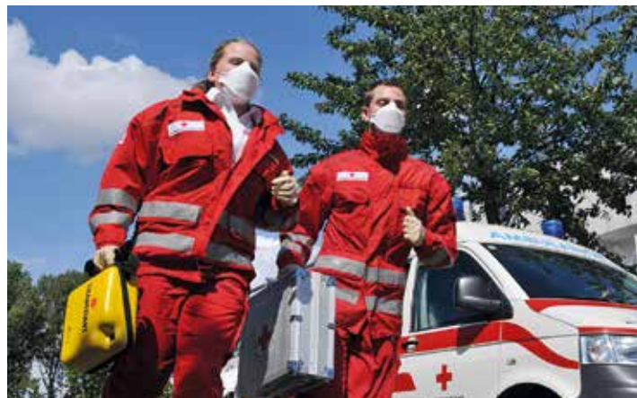
Zwei der insgesamt 2.000 Rotkreuz-Helferinnen und -Helfer, die jeden Tag im Corona-Einsatz sind.

Mit einer echten Zusatzaufgabe, die es in sich hat, wurde das Rote Kreuz Langenlois im April betraut. Als eines von vier „Tester-Zentren“ in Niederösterreich sind die Langenloiser Rotkreuzler für die Logistik sämtlicher Testungen der Organisation im