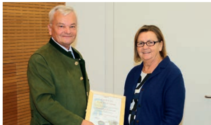
Überreichung der Ehrenurkunde an die Obfrau.