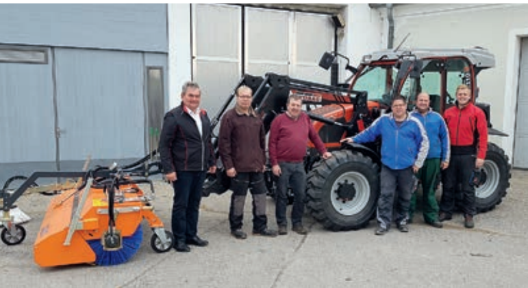
Für den Bauhof wurde ein neuer Traktor angeschafft.

Um zukünftig alle steuerlichen Vorteile welche sich der Gemeinde zukünftig in den Bereichen Abwasserbeseitigung, Wasseraufbereitung, dem Freibad und dem