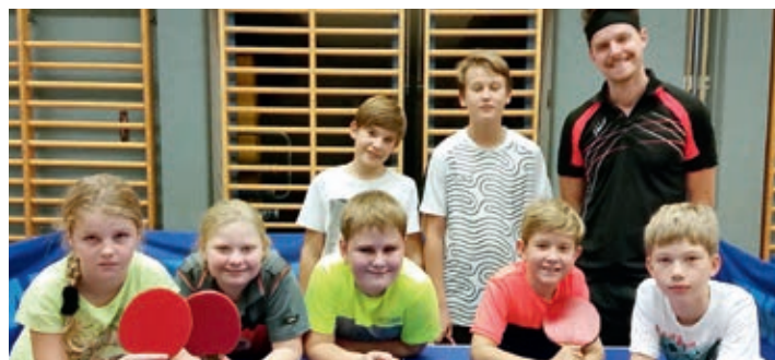
Nachwuchstraining am Freitag