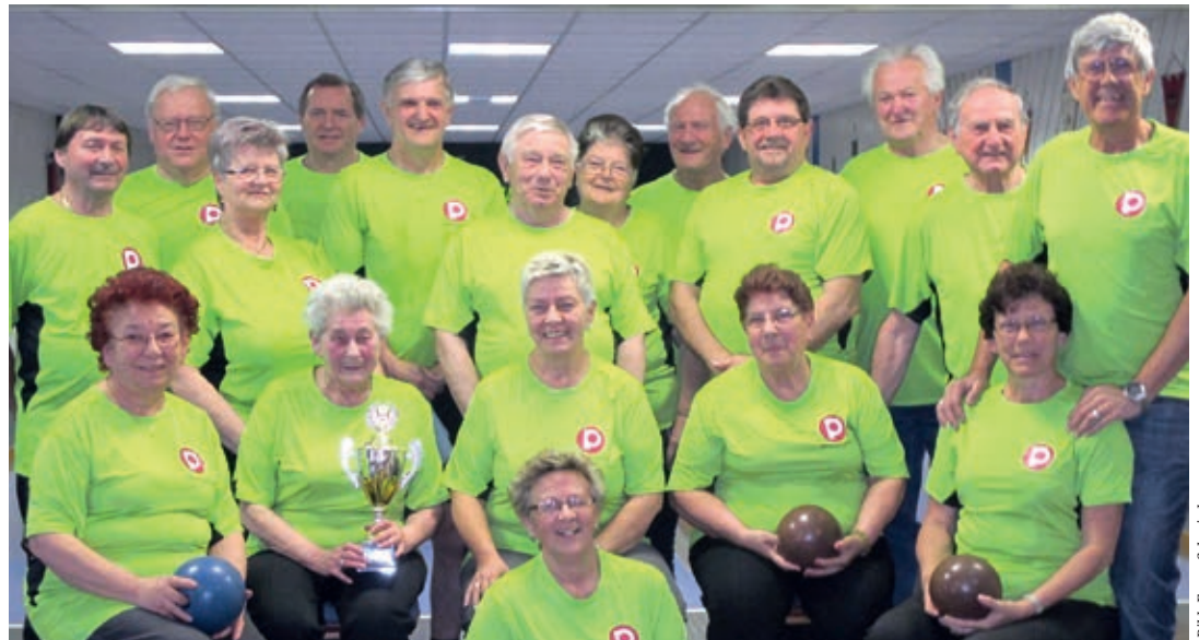
Die Kegelsportgruppe der OG Hadersdorf

Zum Jahresausklang 2018 wird noch die interne Klubmeisterschaft gespielt, wobei erst kurz vor Weihnachten der oder die neue KlubmeisterIn feststeht. Für Spannung