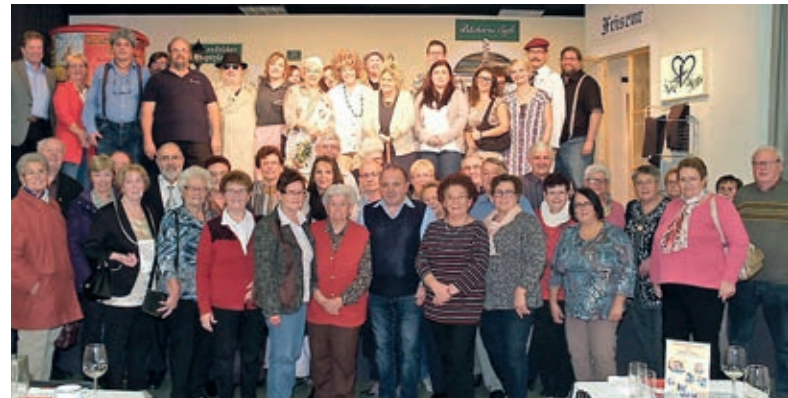
Die Theatergruppe mit Besuchern des PV Hadersdorf & Umgebung