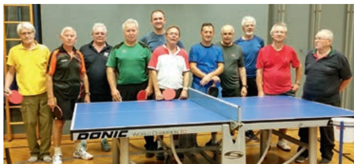
Die fleißigen Hobbyspieler

Trainingstag ist Montag von 17-19 Uhr. Zugang zum Turnsaal ist da über den Geräte-raum (hinten). Das Tischangebot ist derzeit ausgeschöpft.