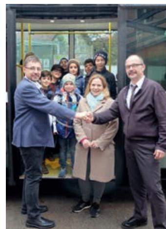
Freude über den Bus haben neben den Kindern auch Eltern, Busfahrer und der Schulleiter

Wegen des großen Interesses an der NMS und PTS Grafenegg wurde der Schülertransport zusehends schwieriger. Vor allem der Frühbus war bis Anfang November heillos überfüllt. Durch intensive Bemühungen seitens der Schule konnte mit einem Verantwortlichen der VOR (Verkehrsverbund Ostregion) eine rasche und unbürokratische Lösung erzielt werden. Ein zusätzlicher Autobus auf der Strecke zwischen Theiß und Etsdorf ermöglicht den Kindern nicht nur angenehm, sondern auch sicher in die Schule zu kommen.