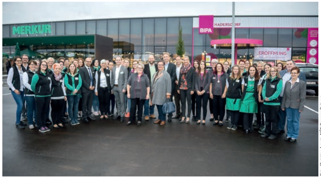
Ehrgäste und Mitarbeiter anlässlich der feierlichen Eröffnung von BIPA und Merkur.

Das heurige Jahr ist das stärkste Expansionsjahr in der Geschichte von MERKUR und umfasst zahlreiche Neueröffnungen und Umbauten in ganz Österreich. Einige dieser Neueröffnungen werden in einem vollkommen neuen, flächenmäßig kompakteren Format gestaltet. Am 21. September öffnete nun der zweite dieser Märkte in Hadersdorf seine Pforten und lässt Kunden ihren Einkauf in echter Marktplatzatmosphäre genießen: So erinnert sowohl die Anordnung der Frischebereiche als auch die gesamte Aufmachung mit Körben, Kisten, Holz- und Tafeloptik sowie Kreideschrift an einen Marktplatz. Dieser Gedanke wird auch im Sortiment durch eine Vielzahl heimischer Produkte von regionalen Lieferanten unterstützt. „MERKUR steht für