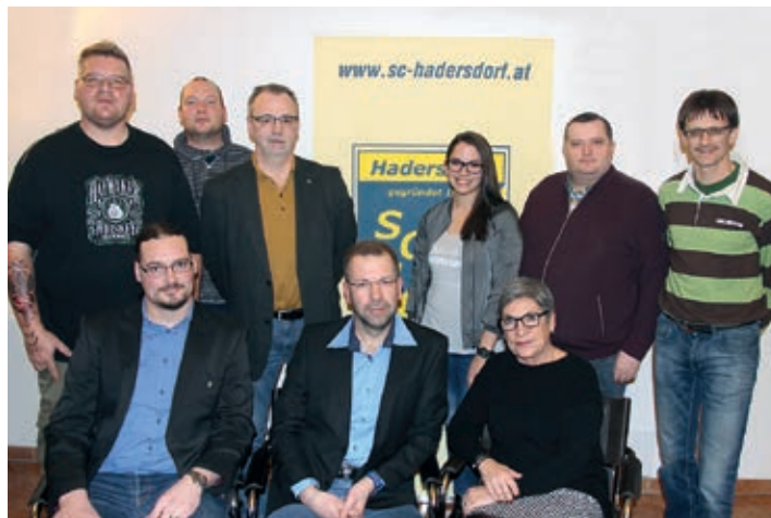
Der Vorstand des SC Hadersdorf

Nähere Infos und Termine findet man auch im Internet unter www.sc-hadersdorf.at .