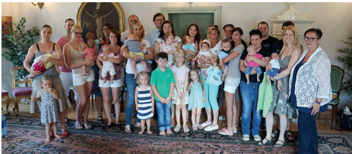
Am Mittwoch, dem 3. August 2016, lud Bürgermeisterin Liselotte Golda zum jährlichen Babytreff in den Trauungssaal des Rathauses zu einem gemütlichen Kennenlernen. Viele Jungfamilien folgten der Einladung. Bei dieser Zusammenkunft konnten die Jungeltern in einer gemütlichen und entspannten Atmosphäre ungezwungen miteinander plaudern.