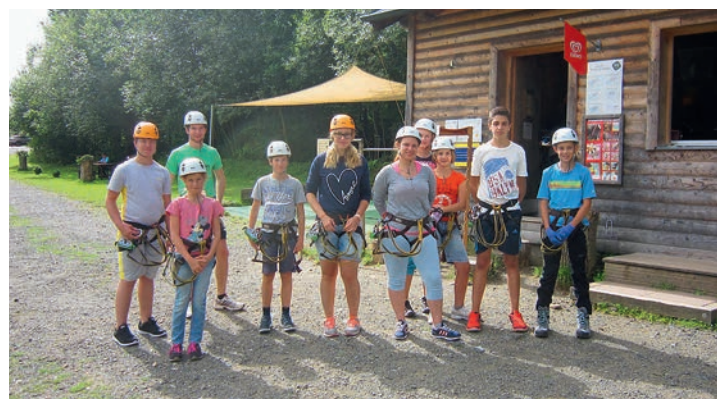
Die Feuerwehrjugend im Kletterpark Rosenberg.