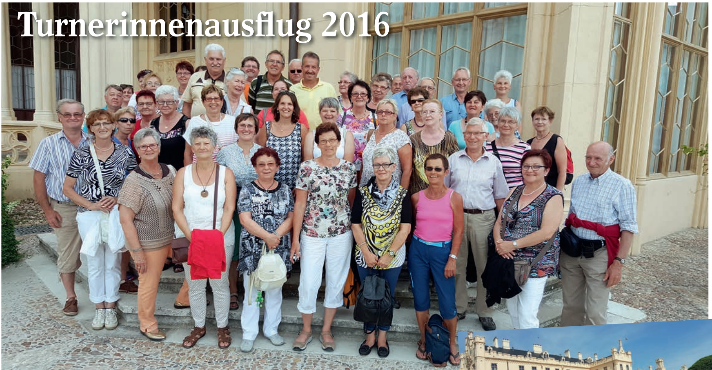
Am 29. Juni 2016 besuchten wir unsere tschechischen Nachbarn. Wir besichtigten das wunderschöne Schloss Lednice und das Palmenhaus. Bei herrlichem Sommerwetter machten wir eine Schifffahrt vom Schloss durch die wildromantische Auenlandschaft vorbei am Minarett zur Johannesburg. Zurück zum Schloss ging es mit Pferdewagen. Der schöne Tag nahm beim Heurigen Böhacker einen gemütlichen Ausklang.