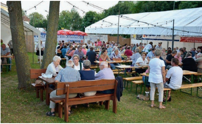
Das 3. Senioren-Grillfest am 20. und 21. August 2016 war ein Highlight dieses Jahres.