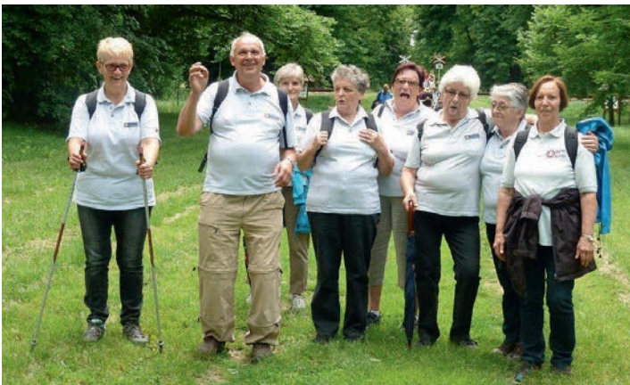
Senioren-Wandertag in Ladendorf