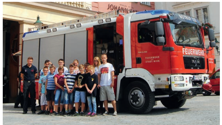
Besuch bei unseren Kollegen von der Berufsfeuerwehr Wien.