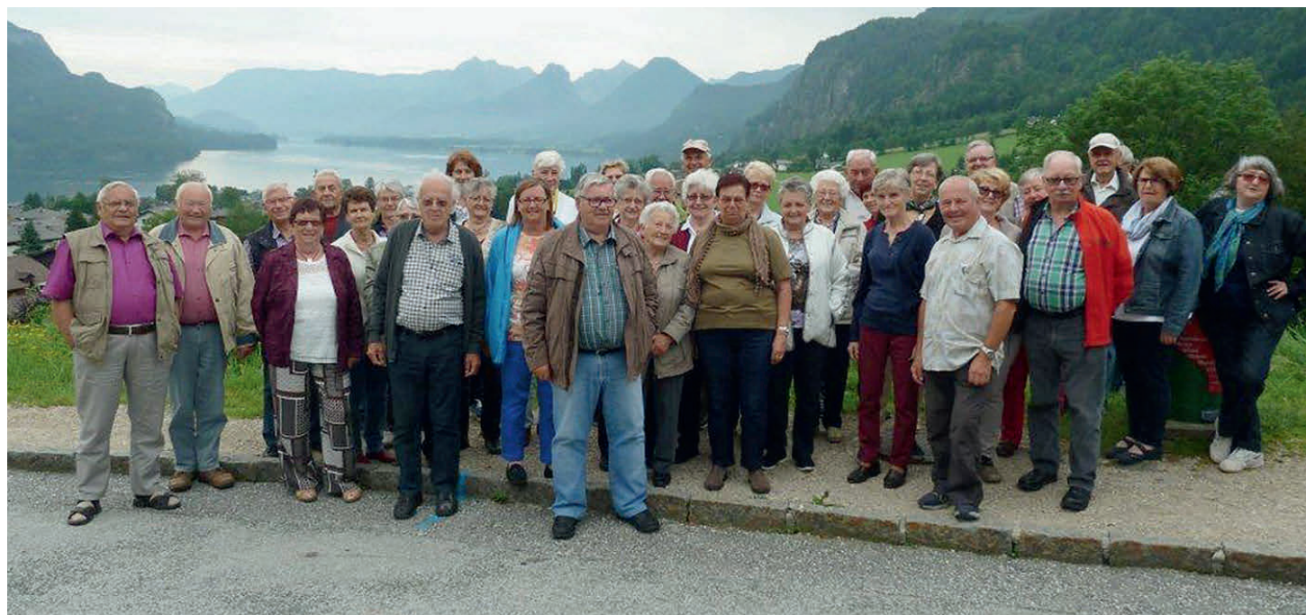
Die Teilnehmer an der diesjährigen Sommerreise des Seniorenbundes

Zahlreiche Aktivitäten bereicherten den Sommer der Mitglieder des Seniorenbundes Hadersdorf-Kammern.