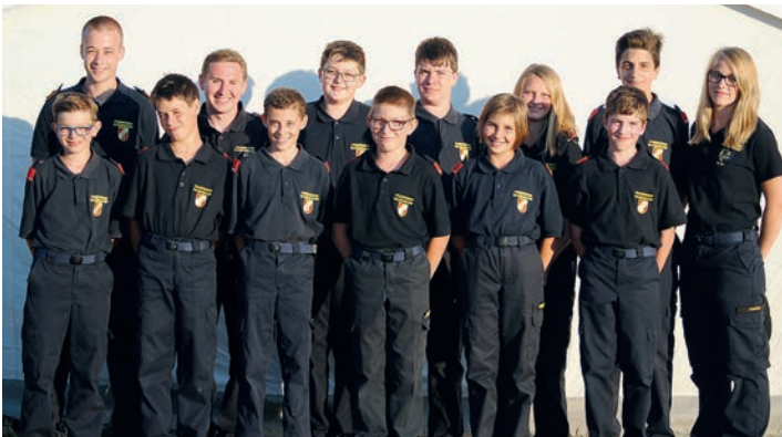
Unsere Teilnehmer am Landeslager der NÖ Feuerwehrjugend.